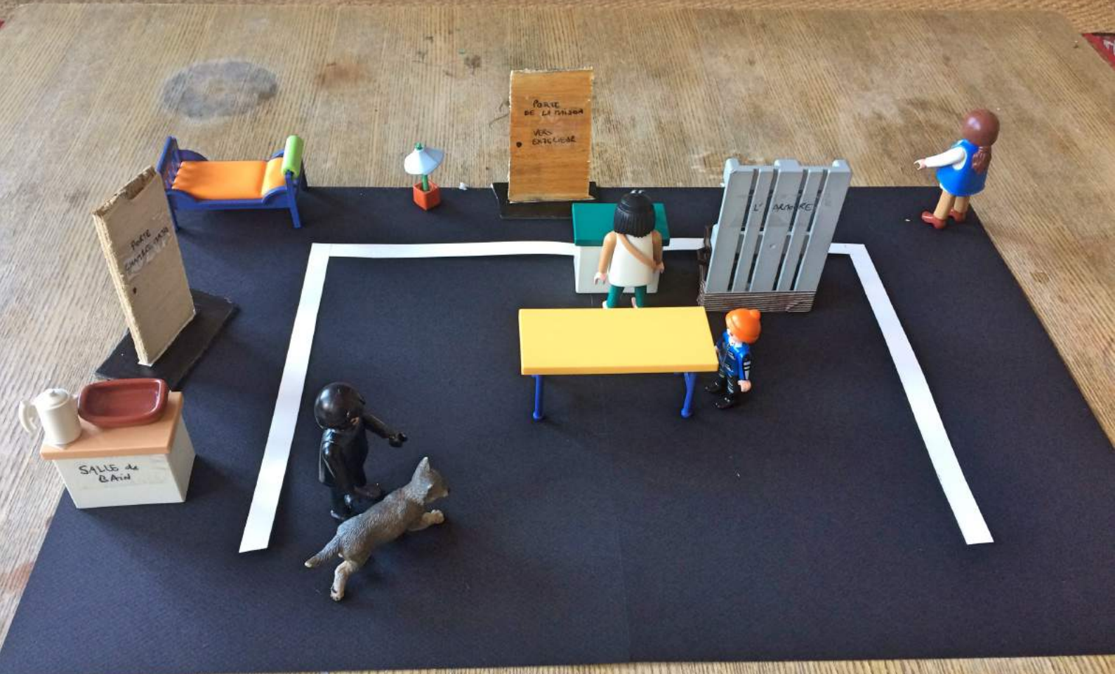
Scénographie: Plan de face